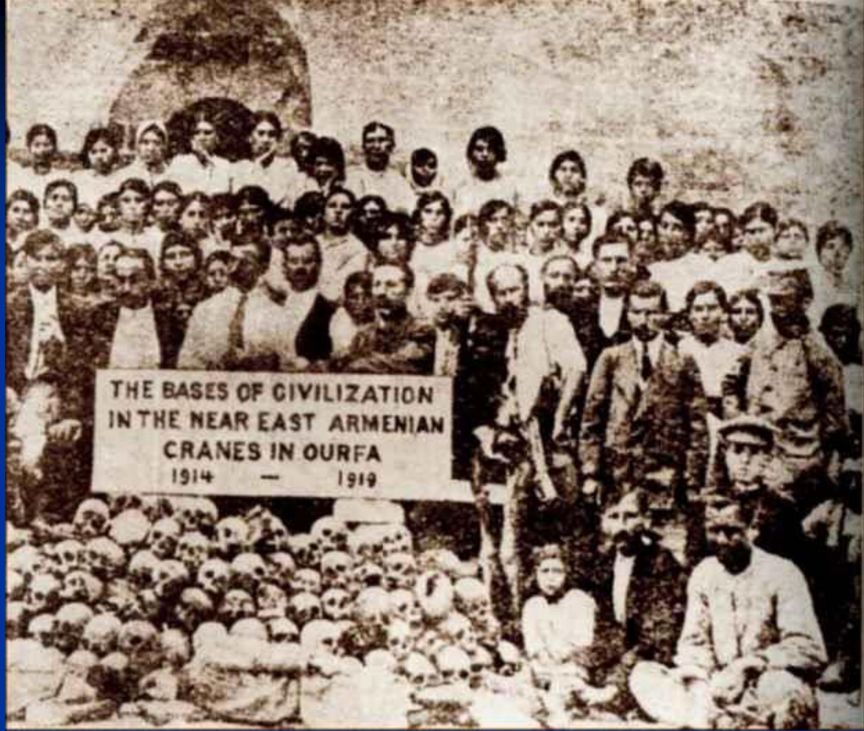
THE BASES OF CIVILIZATION IN THE NEAR EAST ARMENIAN CRANES IN OURFA 1914 — 1919